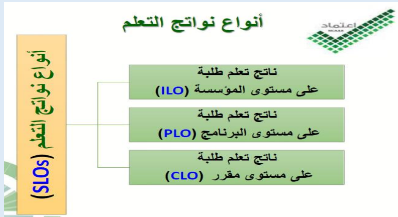
الشكل 2: أنواع مخرجات التعلم. المركز الوطني للتقويم والاعتماد الأكاديمي

تسعى مخرجات التعلم على مستوى المقرر إلى تحقيق مخرجات تعلم البرنامج، حيث يتم وضع مخرجات تعلم لكل مقرر من مقررات البرنامج وترتبط بالمادة الدراسية التي يشملها المقرر، ولذا فهي تشتق من مخرجات التعلم المستهدفة على مستوى البرنامج. كما يرتبط كل مخرج تعلم من مخرجات المقرر بأساليب تدريس ووسائل تقييم تناسب معه وتضمن تحقيقه وقياسه، وسيتم استعراض هذا الارتباط في نماذج المركز الوطني للتقويم والاعتماد الأكاديمي لاحقا في هذا الدليل.