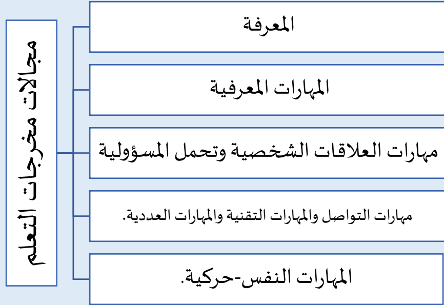
الشكل 1: مجالات مخرجات التعلم بناء على الإطار الوطني للمؤهلات ونماذج المركز الوطني للتقويم والاعتماد الأكاديمي

وفي هذا الصدد، وضع المركز الوطني للتقويم والاعتماد الأكاديمي مجموعة من الوثائق تتعلق بصياغة مخرجات التعلم، من أهم هذه الوثائق توصيف المقرر وتوصيف البرنامج الأكاديمي، حيث تعرض هذه الوثائق إطاراً خاصاً لمخرجات التعلم على مستوى البرنامج والمقرر، يغطي هذا الإطار المجالات الخمسة من مخرجات التعلم وهي: