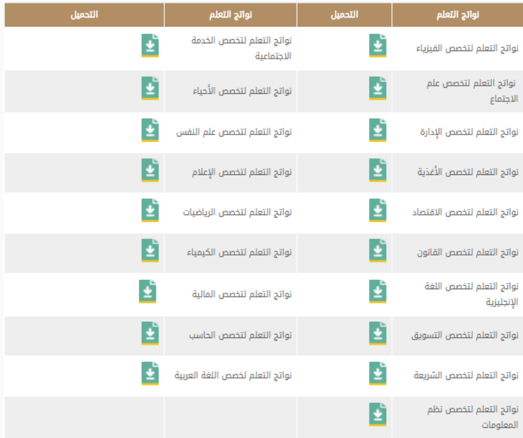
الشكل 5: مجموعة من مخرجات التعلم للبرامج، مشروع مخرجات التعليم العالي، المركز الوطني للقياس