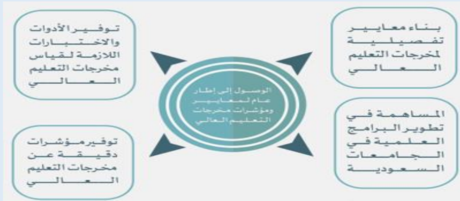
الشكل 4: أهداف مشروع مخرجات التعليم العالي، المركز الوطني للقياس

كما أن المركز الوطني للقياس التابع لهيئة تقويم التعليم قد بدأ مشروع مخرجات التعليم العالي والذي يهدف إلى تعزيز جودة المخرجات التعليمية للبرامج الجامعية، ومساعدتها على تحقيق معايير الاعتماد الأكاديمي، وضمان ملاءمتها لمتطلبات سوق العمل وقياسها من خلال مؤشرات الأداء المناسبة ووضع الخطط التحسينية اللازمة. الشكل رقم (4) يوضح أهداف مشروع مخرجات التعليم العالي.